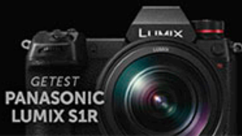
GETEST PANASONIC LUMIX S1R

Goed Glas #6 Middenformaat & grafieken 3-stapsverscherping